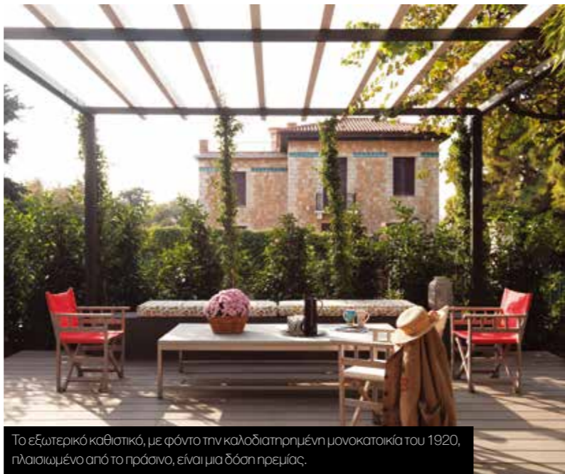
Το εξωτερικό καθιστικό, με φόντο την καλοδιατηρημένη μονοκατοικία του 1920, πλαισιωμένο από το πράσινο, είναι μια δόση πρεμιάς.